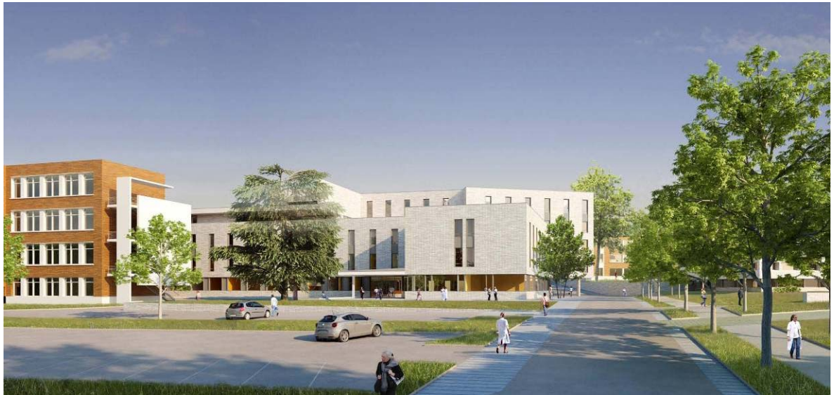
Vue de la façade sud : ENTREE PRINCIPALE

Le bâtiment ELISABETH BOURGEOIS a été dimensionné pour environ 3 000 naissances, correspondant aux besoins du bassin de vie comme en témoigne l'évolution de l'activité obstétricale de ces dernières années.