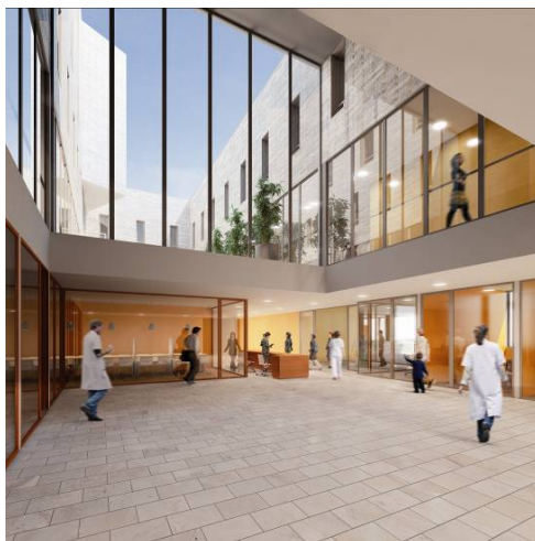
LE PATIO CENTRAL

Par ailleurs, l'accès au plateau technique de l'hôpital (situé dans le bâtiment Changeux) permet d'améliorer la sécurité médicale ainsi que les conditions de travail des personnels.