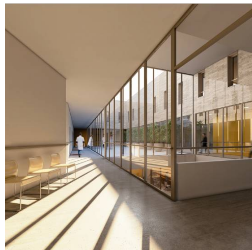
VUE DU 1 ER ETAGE