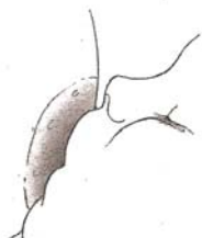
Bébé qui suce façon tétine

Le bébé a les gencives serrées. Éloigné de l'aréole, il prend « du bout des lèvres ».