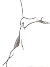
Bébé qui tète bien façon sein

Bouche grande ouverte, langue sous l'aréole, le menton collé au sein, il prend à pleine bouche.