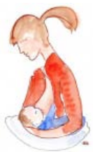
ballon de rugby