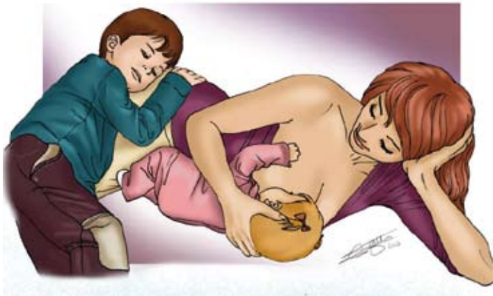
■ Allongée sur le côté sein extérieur