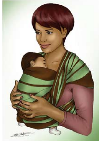
■ L'écharpe de portage

Pendant cet apprentissage, vous allez repérer les rythmes de sommeil et d'éveil de votre enfant, plus courts que ceux de l'adulte. Lors de la tétée, les aînés peuvent se sentir mis à l'écart. Ils apprécieront que vous