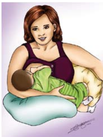
■ La madonne ou la berceuse