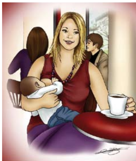
■ Allaiter à l'extérieur

Seuls ceux que bébé n'aime pas sont à éviter.