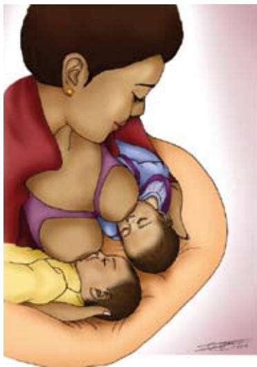
■ Allaiter des jumeaux

Dans tous les cas, avoir des jumeaux demande beaucoup de disponibilité. Les mères ont besoin de soutien, d'encouragements et de détermination.